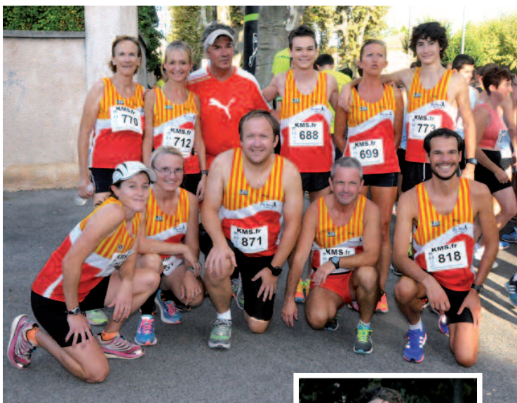
Une partie des licenciés d'Aix Athlé rassemblée juste avant le départ.