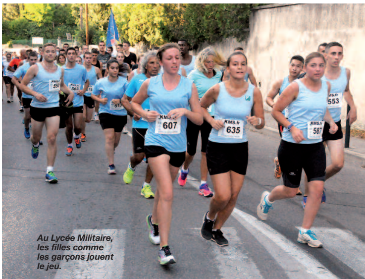
Au Lycée Militaire, les filles comme les garçons jouent le jeu.

Mais du premier au dernier (... arrivé avec un retard de plus de 50 minutes), on a beaucoup souffert lors de cette course Aix s'élance, car le parcours casse-pattes par la route du Tholonet et le sublime parc de la Torse s'est durci en raison de la chaleur lourde de cette fin d'après-midi du 12 septembre 2015.